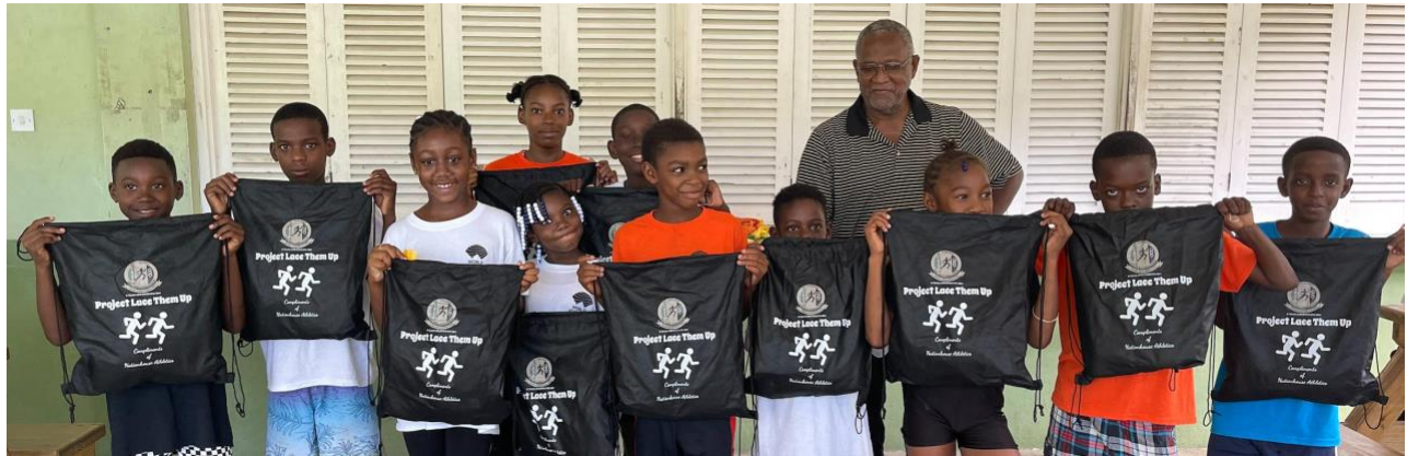
Young athletes pose with their kits from Project Lace Them Up, each carrying TASVG's logo

TASVG's coaches will meet tomorrow, Monday 31 January, to engage in discussions relative to the year's roll-out of developmental meets and competitions as outline sin the annual Calendar. Now that the country has a synthetic track, discussion will also focus on the selection process regarding overseas-based athletes.