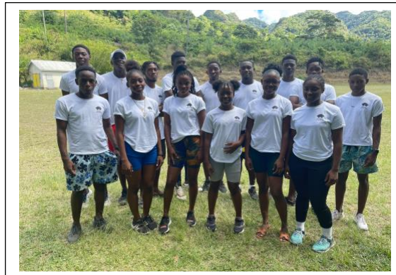
Young trainee assistants in Kids Athletics