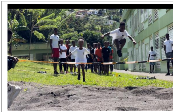
Kids in Action