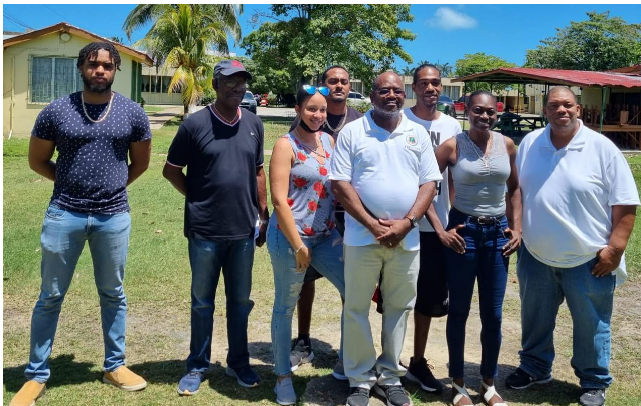
Members of the newly elected Executive of the Belize Athletics Association