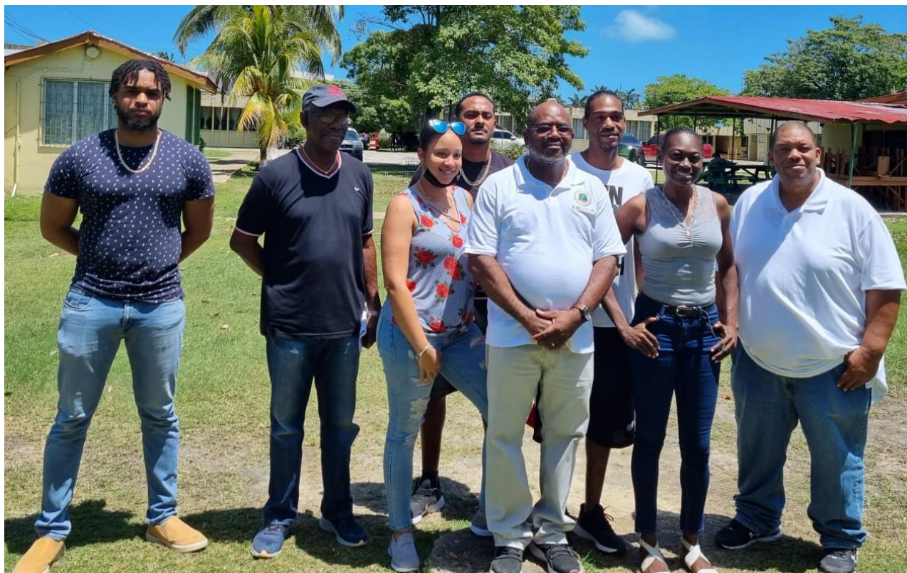
Miembros del recién elegido Ejecutivo de la Asociación de Atletismo de Belice