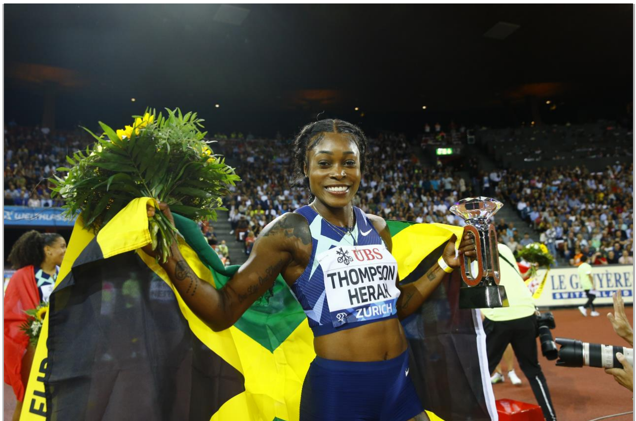
Jamaica's Elaine Thompson-Herah celebrates winning the women's 100m

Thompson-Herah and Crouser are NACAA Athletes of the Year